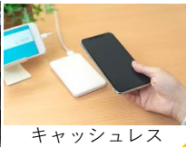
キャッシュレス決済