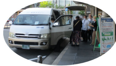
京都駅～金閣寺間の乗合タクシー