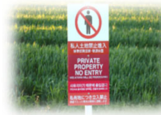
マナー啓発の看板の設置