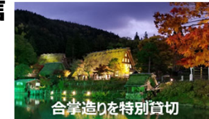
合掌造りを特別賞切