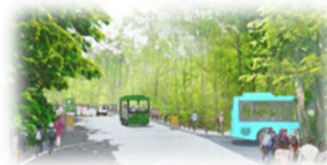
マイカー規制・新たな交通モードの導入