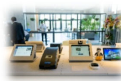
スマートチェックイン・アウト