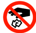
捨てるな Do not throw rubbish