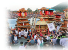
住民とともに地域行事の企画・運営を行うプログラム