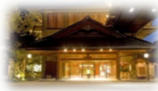
宿泊施設の大規模改修

地域一体となった 面的な宿泊施設の改修、廃屋撤去 等による観光地の再生・高付加価値化を引き続き推進