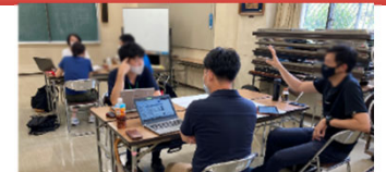
地域の協議の様子