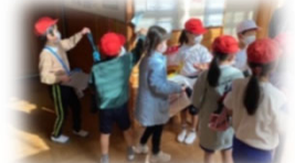
子育て世代を対象に現地の学校等へ入学体験