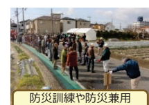
防災訓練や防災兼用井戸の整備