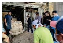
環境負荷低減への取組