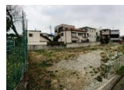
駐車場を活用し、コミュニティ農園を創設