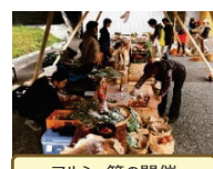
マルシェ等の開催