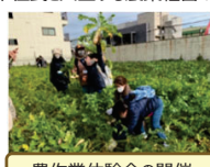
農作業体験会の開催