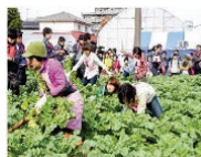
農村ファンの拡大