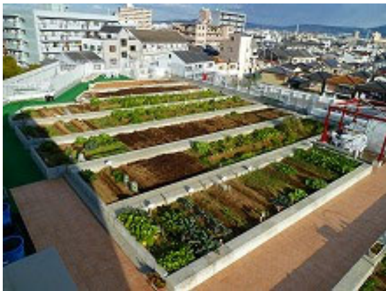
商業施設の屋上で貸し農園を運営