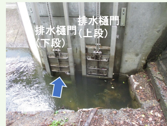
排水樋門(下段)からの排水状況