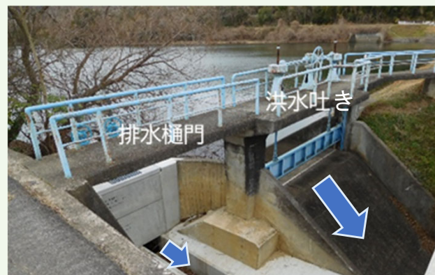
岩田大池の洪水吐きと排水樋門(下流側から)