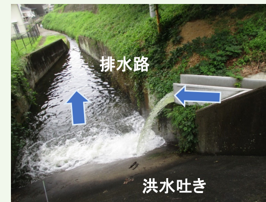
排水樋門(下段)から排水路への排水状況