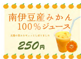
直売所で販売されているジュース

《(参考)NPO 法人南伊豆湯の花》 http://yunohana-shop.com/