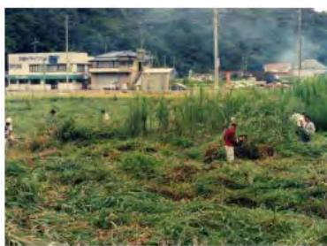
荒廃農地の草刈り作業