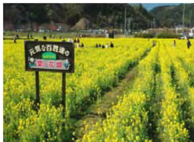
元気な百姓たちの菜の花

荒廃した農地への対策として取り組んだ菜の花の栽培が認知され、その規模が拡大していくことで町内の多くの機関・団体が参画するようになり、菜の花の栽培が地域を挙げた大イベント「元気な百姓祭」として定着した。