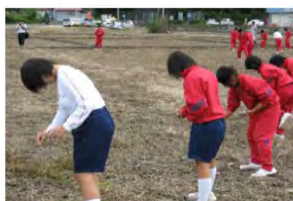
中学生による菜の花の種まき