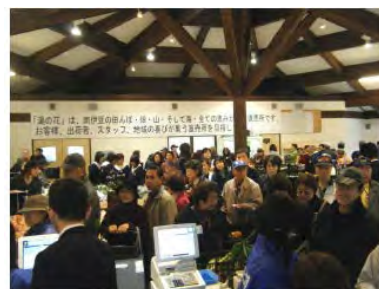
大勢のお客でにぎわう直売所