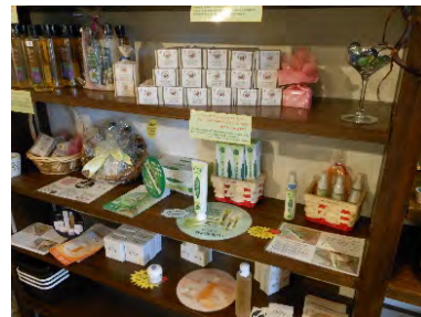
レモングラス関連商品をティーハウスで販売