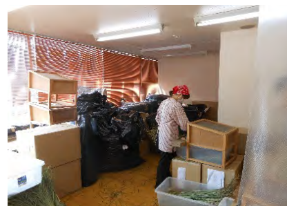
ティーハウス別室での二次加工の様子