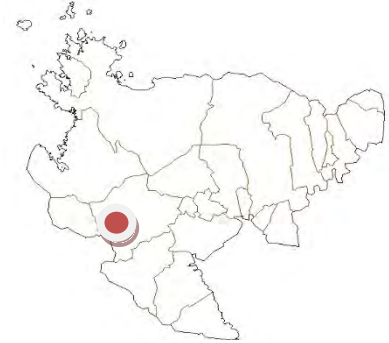
たけお 佐賀県武雄市

企業との連携による加工品の開発・販売や物産館・旅館・インターネット等での商品販売を展開している。