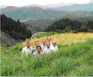
レモングラスの生産者

中山間地域の遊休農地対策として、高齢者の生きがいにもなるような収益性の高い農作物の導入と産地化を検討する中で、レモングラス（レモンに似た香りのするイネ科食物）の栽培を開始し、平成 20 年に農家、集落営農組織により農事組合法人を設立した。