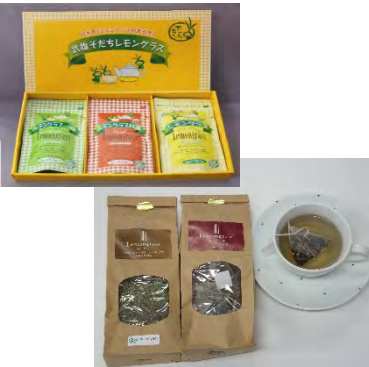
レモングラスを使った商品