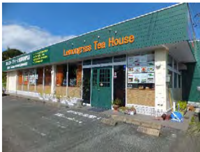
レモングラスティーハウス

中山間地域の遊休農地を解消して、レモングラスを栽培することで、中山間地域が有する洪水防止・土砂崩壊防止・土壌侵食防止機能等を維持・発揮している。