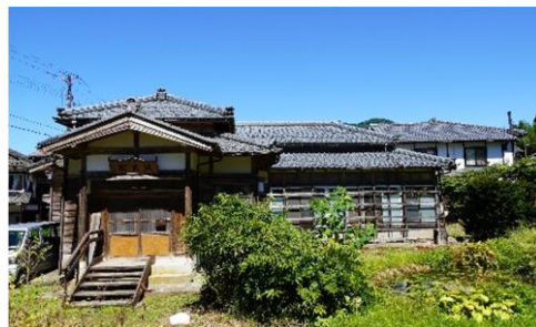
写真9 ゲストハウス「瑞泉閣」

また、空き家を活用したシェアハウスを整備し、移住志向者・農業参入志向者等のお試し移住の場として活用するなど多様なニーズにも対応している。