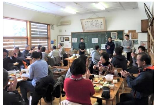
写真4 食堂 I R O R I

さらに、天蓋山と東京スカイツリーが634mということから参加した「634（ムサシ）サミット」が縁で墨田区との交流が始まり、平成27年から毎年、墨田区商店街の協力により「高根物産展」を開催するなど、さまざまなチャンネルを活用し、地域の特産品である棚田米の販売拡大に取り組んでいる。