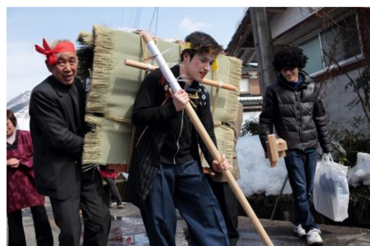
写真 8 箆筒送り