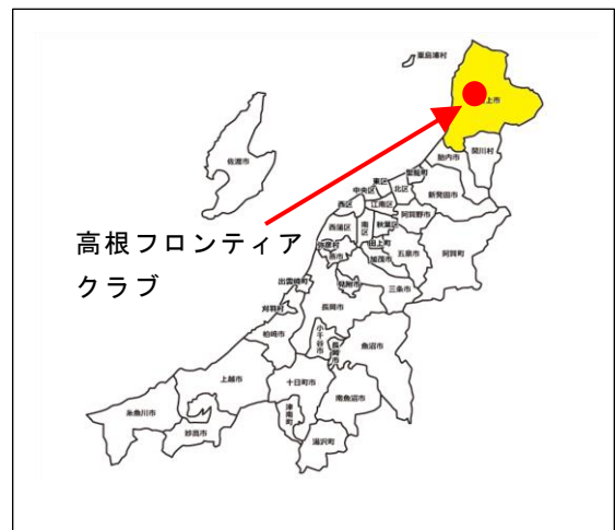
第 1 図 位置図

鮭をぶら下げる独特の鮭文化が根付いている。北部の海岸は、「笹川流れ」と呼ばれ国の名勝天然記念物（県立自然公園）に指定されており、見事な景観を誇る延長 11 キロメートルに及ぶ美しい海岸線が見られる。北限の茶処として有名な「村上茶」は、独特のまろやかさで、高級茶として親しまれている。