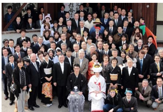
写真 7 伝統の結婚式

平成 26 年 3 月に、N P O 法人の活動を通じて本地区に移住した若いカップルの結婚式が、30 年ぶりの伝統「 たんすおく 箆筒送り」として行われた。これは外からの移住者でも地区でしっかり見守っていこうという“高根の人の心・思い”を象徴する出来事であり、この伝統行事の復活には、道具の収集から唄の稽古まで準備段階から地区住民が一致団結したことにより、昔の様子を再現することができ、当日は約 500 人がお祝いに駆けつけた。