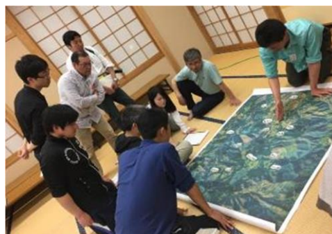
写真 6 棚田の耕作状況調査

高根フロンティアクラブには、若い世代が加入し始めるなど徐々に世代交代が進んでいるほか、クラブの活動が刺激となり、平成 28 年に新たに設立された「(一社)高根コミュニティラボわあら」では、40 歳代以下の若手が活躍し、約 1,300 枚ある高根の棚田の耕作状況調査と 10 年後に耕作されているかどうかの予測を聞き取り、棚田での米づくりを継続するための課題や対策を検討している。さらに、高根棚田米の販売や稲作サポートを組み合わせた会員制度「準村民制度」を目指し活動している。