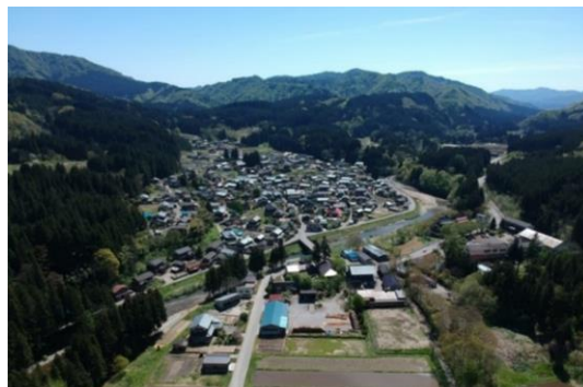
写真 1 高根地区の全景

戸数は 171 戸、人口 470 人あまりが暮らし、主要な産業としては、以前は農林業であったが、現在は市街地周辺で働く人が増えている。農業の主な品目は水稲でコシヒカリなどの棚田米や条件不利地等でそばなどが栽培され、小規模の家族経営が多い。林業では、スギの素材生産のほか、林間わさびなどの特用林産物の生産も行われている。