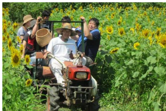
写真 2 天蓋高原夏まつり

クラブ設立後は、組織づくりの勉強、優良事例地区の視察などを重ね、平成 9 年には初めての取組として、遊休地にひまわりを植え「ひまわりフェスティバル」（現在は天蓋高原夏まつり）を開催した。この取組が好評だったことから、毎年開催することになり、今ではクラブを象