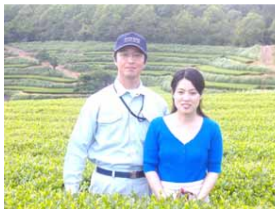
写真2 茶園の後継者

一方、（有）富貴茶園は、水田を「（農）ふき村」に委託したことで、本業に労働力が集中でき、従来と比較して収益性が向上したため、県外で就職していた娘婿がイターンで就農し、後継者が確保された。