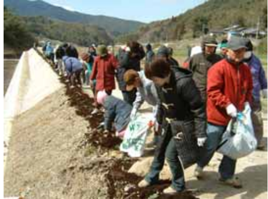
写真3 ツワブキの植栽

ふき活性化協議会では、富貴寺と並ぶ地域のシンボルになるものは何かないと議論を重ねた結果、「落地区・富貴寺」の名前にちなんで「ツワブキ」を河川敷に植栽することとした。実行に当たってはボランティアを募り、平成17年3月に