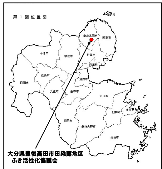
白地区 KenMap の地図画像を編集

豊後高田市は、平成17年3月に豊後高田市、真玉町及び香々地町の1市2町が合併し、新「豊後高田市」として発足した市で、大分県の北東部、国東半島の西側に位置する。海岸部は宇佐平野から続く平坦地並びに江戸時代後期の旧干拓地及び国営干拓地となっており、背後地は国東半島の中央両子山より放射状に山地が走り、この谷間に農地や宅地が存在している。総面積206.6km 2 、人口26,206人の市である。