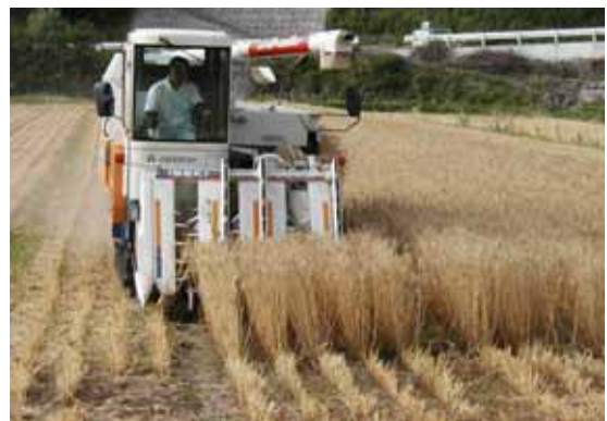
写真1 オペレーターによる作業

作業は、一般作業については全組合員で、大型機械については専任のオペレーターが作業を行っている。