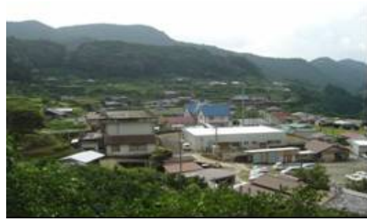
写真 1 平井集落の様子

平井集落は、古座川町の中心部から更に古座川を北へ遡った約 30km の距離にあり、総戸数 83 戸、人口 156 人の山間集落である。平井集落に赴くには、自家用車などを利用する以外は、町が委託している「ふるさとバス」が 1 日 2 往復し古座駅まで運行しているのみである。