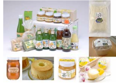
写真3 ユズの加工商品

「平井の里」の前身である「古座川町ゆず平井婦人部」や「平井友の会」は農家の女性達で組織され、女性の感性をフルに発揮して、ユズの加工販売や郷土料理の調理・販売するなど女性の活躍する場を自分達で見つけ実践してきた。現在は、農事組合法人となり、若い女性達も活動に参加するようになった。女性の感性をフルに発揮して加工商品を開発し、品質の良い、人気の高い商品を世に送り出している。地域の女性が熟年だけでなく、若いも若きも、生き生きと活躍できるような環境づくりをめざしている。