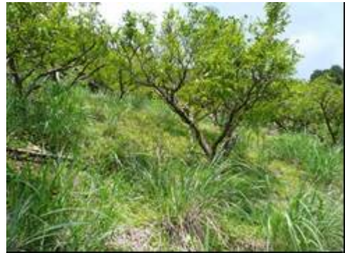
写真2 平井のユズ園

「古座川ゆず平井婦人部」が結成された昭和60年以来、「古座川柚子生産組合」が生産、農協が搾汁及びユズ果汁販売、「古座川ゆず平井婦人部」が二次加工販売といった体制で各者それぞれの組織であったが、「平井の里」がユズの生産、加工、販売を一体的に行うようになり事業の統合・効率化を図った。これによって平成18年度には、加工用ユズ価格は135円/kgを超え、生果価格は350円/kgと平成12年のおよそ2倍となり、安定的な生産が可能となった。また、多様な加工商品と販売先を開拓したことにより商品の知名度が広まった。