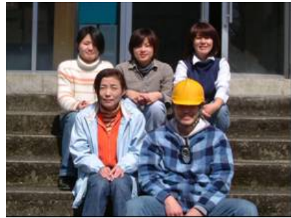
写真4 「平井の里」の 若き従業員達

隣接する下露集落では平成13年に園児2人で始まった保育所があり、現在6人の園児が入所している。内4人は「平井の里」で働く女性の子供である。平井の里で働く常勤従業員22人の内30代以下は8人おり、多くがUターン、Iターンで「平井の里」が設立されてから平井集落に入って来た人である。奥深い山村に若者の定住が進んで来ている。