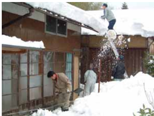
写真4 生活支援活動：雪かき

かつては集落内外問わず、不法投棄が大変多く目についた。槻之屋振興会では「環境の日」に定期的に環境問題の啓発事業やボランティア活動を実施している。槻之屋川の生物調査、環境問題や家電リサイクル法の講演会、投棄ゴミの現場視察、ゴミ拾い、加茂リサイクルセンター見学などのソフト活動とともに、ゴミステーション2基の設置、啓発看板の設置などにより着実に啓発効果を上げ、現在では投棄ゴミはなくなり、さらに環境保全活動(側溝や路傍、水路の掃除等)、生活支援活動(イノシシ被害水路の復旧、倒木撤去、雪かき等)及び環境美化活動(花いっぱい運動、スイセンの植栽、花壇の設置)などを計画的に実施している。