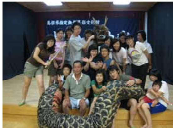
写真3 文化の国際交流:槻之屋神楽

この他にも、しまね田舎ツーリズム研修会開催地、近隣の保育園の芋掘り体験、農林高校生や県立農業大学校生の農業体験学習等を積極的に受け入れ、農作業や地域活動をとおして農村の厳しさや豊かさを伝えている。