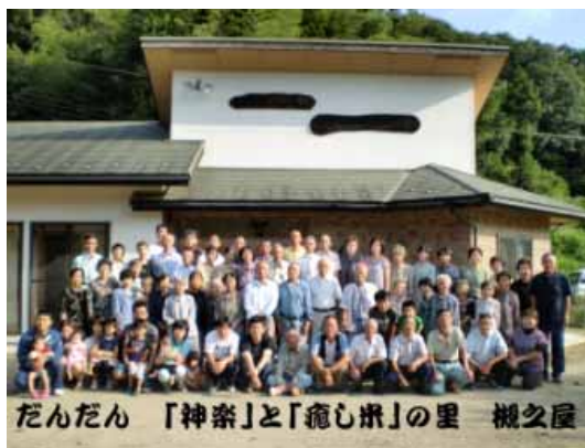
写真1 槻之屋集落の活動拠点 「ふれあい館（公民館）」

ほ場整備の着工が見えてきた平成7年から、ほ場整備後の水田営農ビジョンの検討を始め、集落営農法人設立の方向で合意が図られ、平成10年、ほ場整備の面的工事の開始とともに、有志18名で農事組合法人「槻之屋ヒーリング」が設立された。