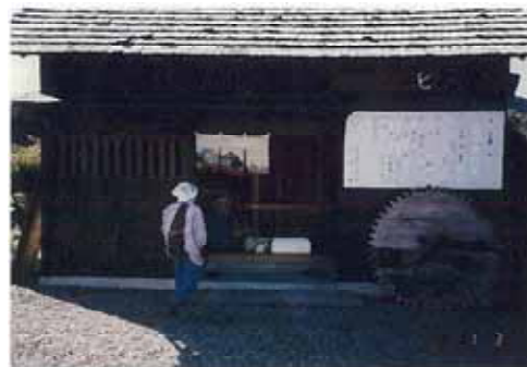
写真1 水車小屋「こっとんこ」

平成4年には、集落の若者たちの企画により「水車のある集落づくり構想」を策定し、以前にあ