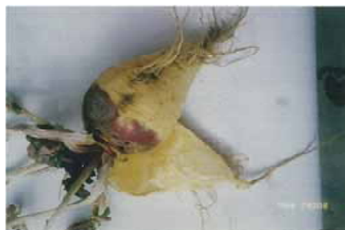
写真2 地域の伝統食材「矢越かぶ」

矢越かぶは、以前から室根地区においてご飯の高増し材料として伝統的に栽培されてきた食材である。一時は絶滅寸前だったものを第12区自治会が栽培を復元させている。野生に近く、甘味があり、食物繊維、ミネラル・ビタミンCが豊富なかぶで、「かぶ蒸かし」は、平成17年に岩手県食文化研究会「岩手に残したい食材30選」にも選定されている。