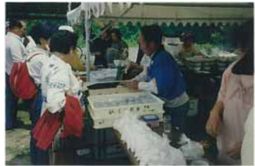
写真4 水車まつりで農産加工物等を販売

毎月1回の「こっとんこ市」や植樹祭に併せた「水車まつり」が開催された際には、地元で生産された農産物や加工品を販売しており、同地区のPRや活性化につながっている。