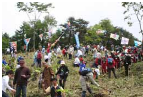
写真3 森は海の恋人植樹祭

会場には大漁旗が掲げられ、全国から訪れた参加者によりケヤキ、ブナ、ヤマザクラなどの広葉樹が毎年7百本から1千本が植えられ、水源涵養の森づくりを進めている。これまでに植樹した本数は3万本、面積にして13ha、参加者は集落人口の約27倍にあたる述べ1万人を越えている。