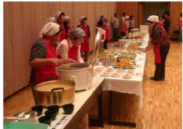
写真3 おばちゃんバイキング

また、研究会が行政等と連携しながら取り組んできた観光客、交流人口を増やす活動は、かつて「陸の孤島」といわれた地域での道路整備の推進にもつながっている。