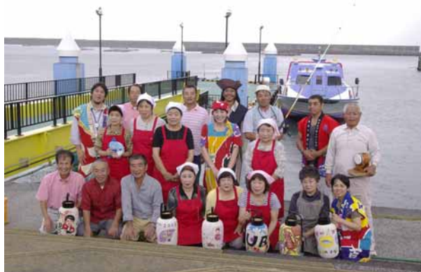
写真1 「あまべ渡世大学」の講師メンバー