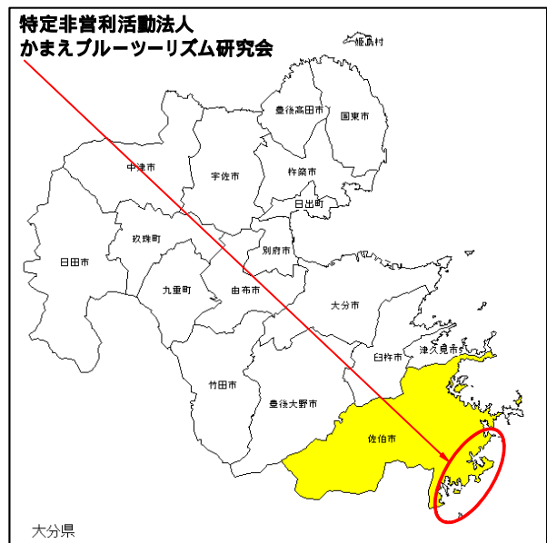
白地図 KenMap の地図画像を編集