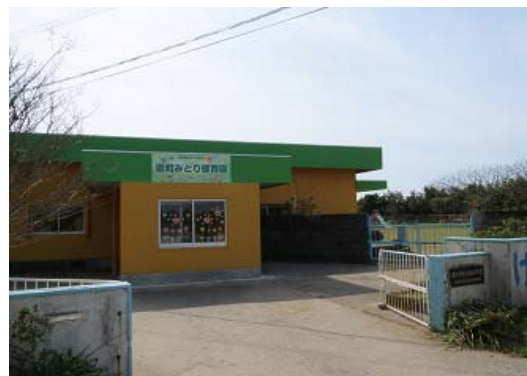
写真4 現和みどり保育園

市の方針により、地区の公立保育園が平成23年度末をもって廃止されることとなったが、地元から地域活性化のためにも残すべきとの声が上がったため、現和校区の住民だけで構成される「社会福祉法人現和会」を平成24年1月に設立し、同年4月から「現和みどり保育園」を運営している。