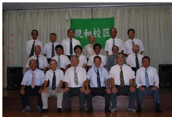
写真1 現和校区の皆さん

そこで、現和校区では、地域が一体となった地域活性化の対策が今まで以上に必要と考え、住民による話し合いを進めた。そして、今までのむらづくり活動に加え、少子・高齢化対策といった社会福祉面の活動にも力を入れることとし、住民が知恵を出しながら新たな活動に取り組むこととなった。