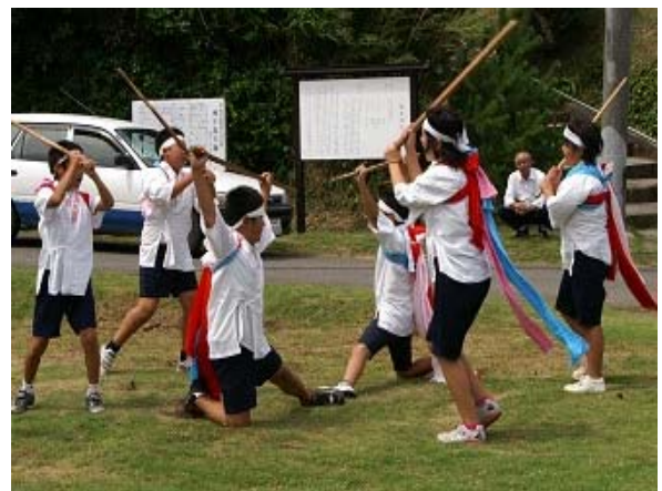
写真3 小学生に継承された伝統芸能

また、地域文化部会が中心となり小・中学生に対する教育の一環として踊りの継承に取り組んでいる。この結果、現和校区においては、県の無形民俗文化財に指定されている武部集落の「種子島大踊り」をはじめ、他地区には類を見ない数多くの郷土芸能が受け継がれている。