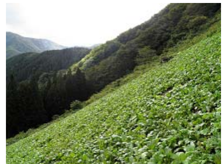
写真2 温海かぶ栽培畑

一霞集落のむらづくりのきっかけは、温海かぶの存続の危機であった。温海地域の温海かぶは焼畑農法で栽培されており、50年程前は、木材の値段も高かったことなどから、杉の伐採跡地を焼いてかぶを栽培し、その後には再生林するという形で健全な山林を育成する理想的なサイクルができていたが、時代の変遷とともに変化が見られるようになってきた。木材価格の低迷によって