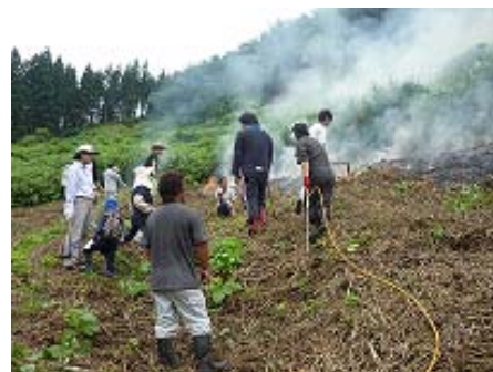
写真4 焼畑体験ツアー

集落の古文書には、16世紀後半には既に焼畑が営まれていた記録があり、「一蕪入魂 ひとかぶ の会」は、一霞集落の暮らしを支えてきた小さな種子を次の世代に受け渡すために活動を実践している。