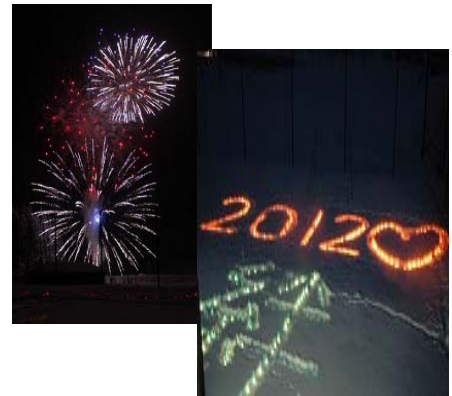
写真6 花火大会と キャンドル祭り

また、平成23年3月11日に発生した東日本大震災により甚大な被害を受けた被災地の復興を願い、花火大会との同時企画として「一霞キャンドル祭り」を開催している。