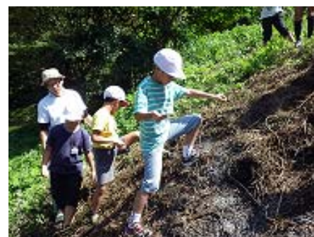
写真5 児童による種まき

また、平成25年から焼畑や集落に興味を持つ大学生や先生に、伝統野菜の研究の一環として農家に宿泊してもらい、食への関心を深めてもらう取組を行っている。これにより、地域の文化や暮らし、これまでの取組が対外的に評価され、住民が地域に自信を持ち、地域への愛着と誇りとなつていっている。