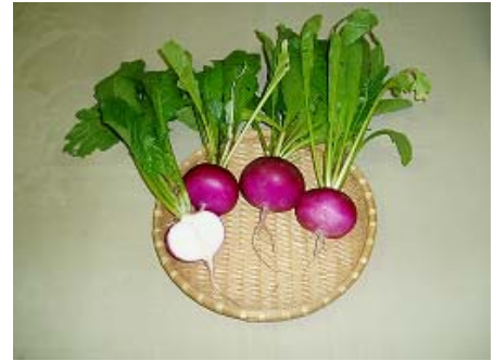
写真1 焼畑温海かぶ

一霞集落では、温海かぶの生産から加工・販売まで集落全体で取り組んでおり、生業としての営農活動につながるむらづくりを展開している。