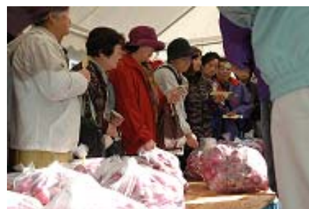
写真3 21世紀かぶ祭りin一霞

毎年11月、集落の公民館を会場に「21世紀かぶ祭りin一霞」が、かぶ祭り実行委員会によって盛大に行われている。かぶ祭りでは農産物や山菜などの販売が行われ、県内外からの沢山のお客さんで大盛況となっている。中でもかぶ祭りでは購入できない生食用かぶは、リピーターも多く即売の盛況ぶりである。