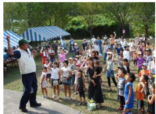
写真2 ぶどうまつりの様子

「ぶどうまつり」は大平町の代表的な行事であったが、地元でのトラブルが原因で開かれなくなっていた。平成19年、ぶどう農家からの要望もあり、8年間途絶えていたぶどうまつりを南山麓友の会と地域が連携して復活した。ぶどうまつりの開催に当たっては、行政の直接的な支援を受けておらず、そのことが会員や住民たちの大きな自信につながっている。