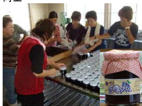
写真4 ジャム作りの様子

現在、栃木県足利市においてワイン製造と販売を行うココ・ファーム・ワイナリーへの供給を基本としてワイン用品種の栽培にも取り組み、高齢者の収入源と