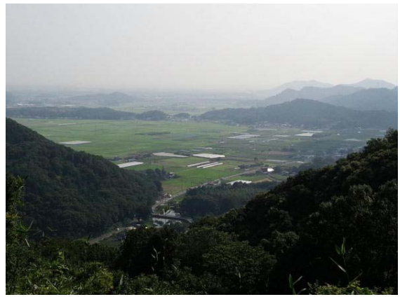
写真1 太平山から望む西山田地区

た地区であり、古くから住民の結び付きが強く、伝統と賑わいのある地域であった。戦後、大平町の平野部が基盤整備に伴って発展する一方、西山田地区は整地が遅れ、大平町の「3大へき地」に数えられるようになった。