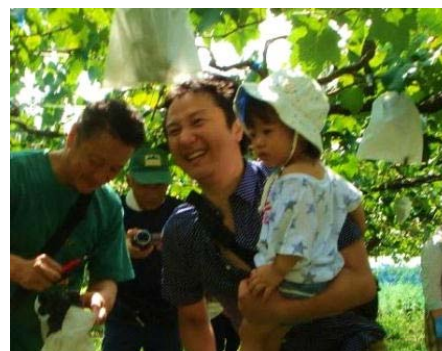
写真3 ぶどう狩りの様子