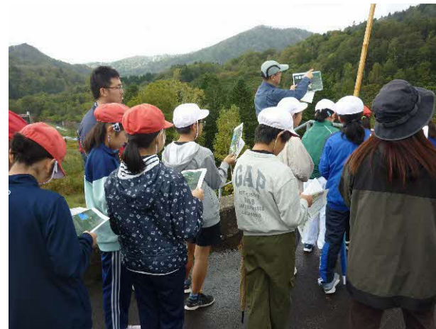
小学生向けに見学会を実施