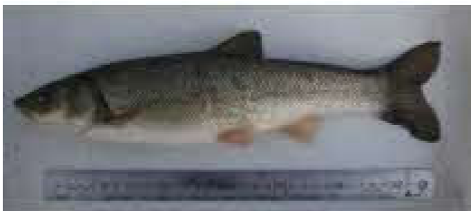
事業実施前に確認されたウグイ等 魚類が実施後も確認されている