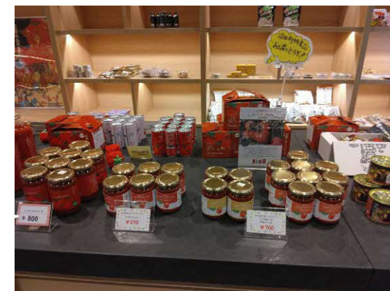
地区内で生産された野菜や米、加工品（トマトピューレ等）などを販売