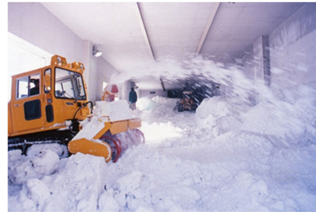
低温冷蔵施設「スノークールライスファクトリー」(JA北いぶきが運営) 雪冷房により、品質低下を防ぎブランド米の推進拡大を下支え