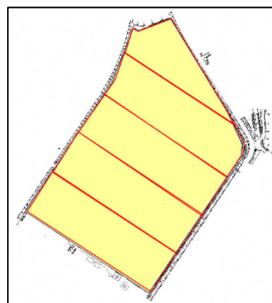
ほ場の大区画化（標準区画：50a→1.3ha）