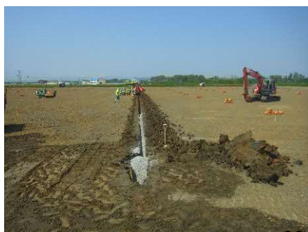
過湿被害を解消するため、暗渠排水を施工