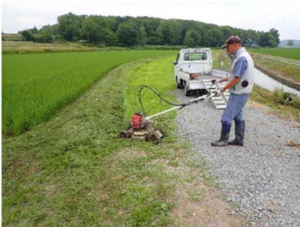
地域住民と連携して草刈りを実施