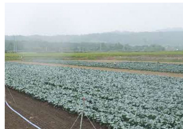
ブロッコリーの栽培状況