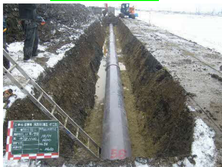
老朽化の著しい用水路を改修