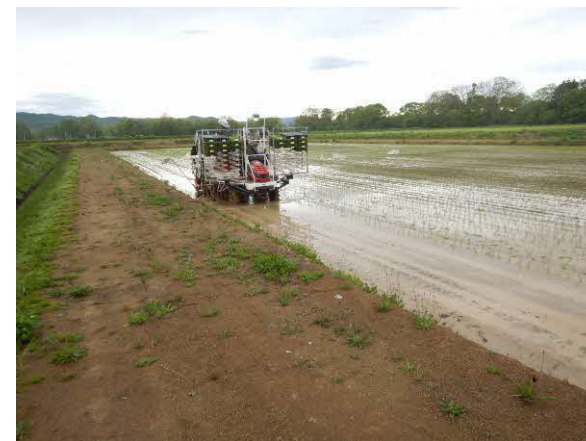
大区画ほ場における田植えの状況