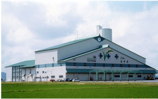
低温冷蔵施設「スノークールライスファクトリー」 (JA北いぶきが運営)