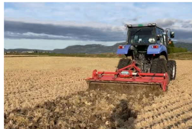
排水性の改善により、環境保全型農業の 取組である稲わらの秋すき込みを推進