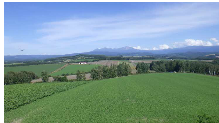
大雪山連峰と広大な畑