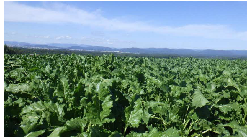
法人の主力作物である てんさい