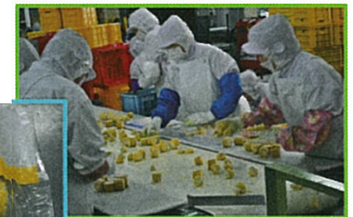
スイートコーン→野菜フレーク・冷凍野菜