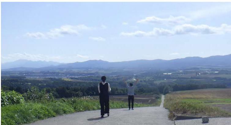
「就実の丘」 多くの観光客が訪れるビュースポット