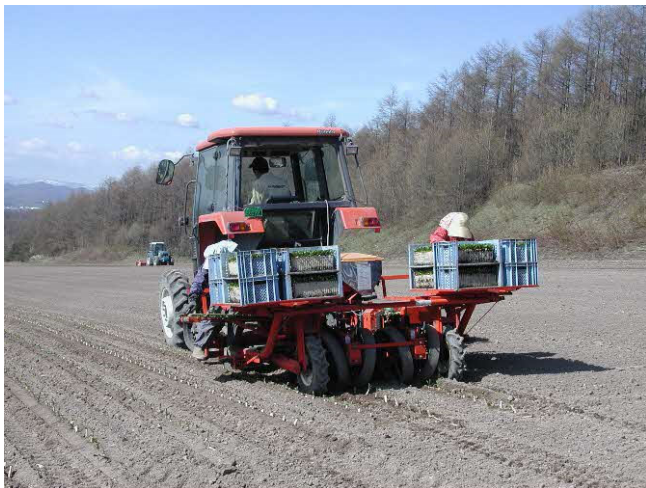
てんさいの移植作業