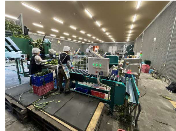
集出荷貯蔵施設 (JA東神楽が運営) 加工用スイートコーンの選別作業