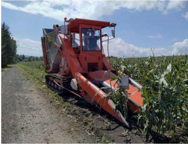
スイートコーンの収穫