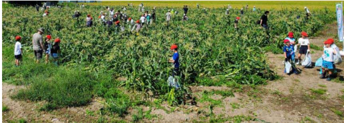
小学生 スイートコーン収穫体験