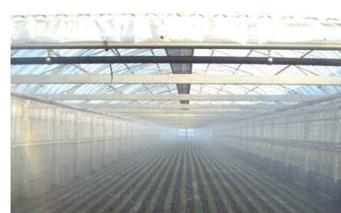
葉ねぎ施設かん水の様子