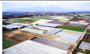
農業法人有限会社大崎農園の施設の様子

現在38名を雇用する中で、農作業マニュアルの策定、生産工程・作業時間の数値化に取り組むなど、農業経営を見える化し、経営の効率化と生産性を向上。