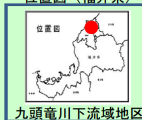
九頭竜川下流域地区