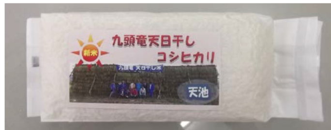
天日干しのコシヒカリ

パイプラインでの出穂期以降の冷たい水による夜間かんがいが可能になり乳白米等の発生（高温障害）が抑制され、米の品質や食味が向上することを契機として、天日干しも実施している。