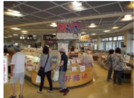
「ふれあいパーク三里浜」 で花らっきょ等を販売

生産物は三里浜特産農業協同組合に出荷し加工なども行われており、その直売所として道の駅との複合施設「ふれあいパーク三里浜」で農産物・加工品が販売されている。