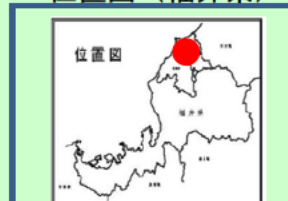
九頭竜川下流域地区