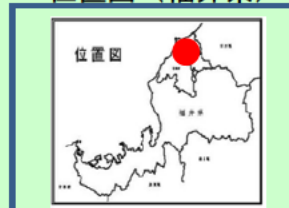
九頭竜川下流域地区