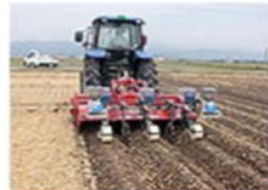
大豆の畝立同時播種