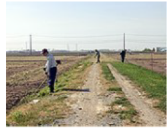
除草剤低減のため畦畔の 草刈りを実施