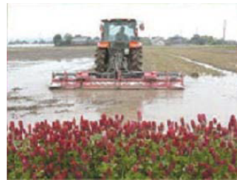
クリムソクローバー で作り上げるコシヒカリ

クローバーの一種で別名ストロベリーキャンドルというマメ科の植物。秋に播種し、翌年5月にイチゴのような花をつけるため、景観形成にも適した上に、マメ科であるため土壌中に窒素を蓄え稲の生育に十分な肥料となる。