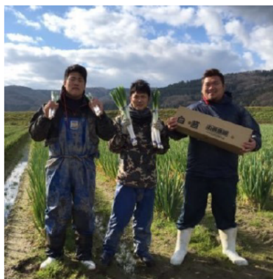
小西農園の園主と従業員（10・20代）

2, 3年前まではJAに100%出荷していたが、現在は販路を開拓し、JA以外にも生協、直売所（2カ所）、焼き鳥店などの県外の顧客にも販売している。