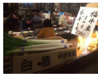
東京新橋の飲食店での販売・利活用