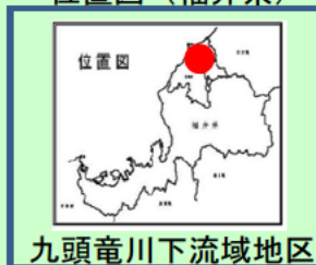
九頭竜川下流域地区