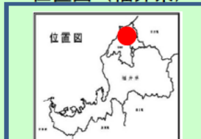
九頭竜川下流域地区