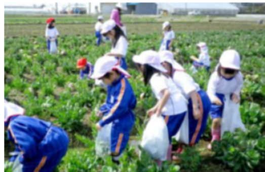
参加体験型の農業