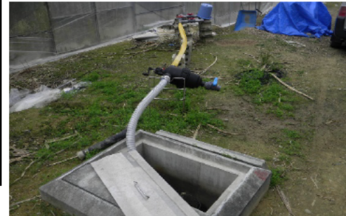
ろ過装置により かん水チューブの目詰まりを防止

現状はにがうり、ピーマンの経営だが、島内の民宿等から要望がある野菜は、新たな販路として期待される。