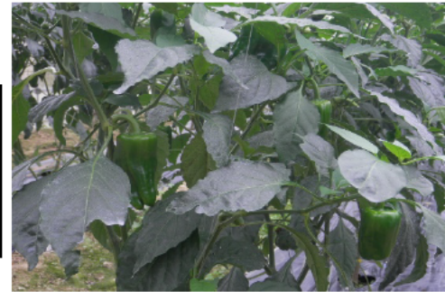
収穫前のピーマン

給水施設が整備されていたことで、かん水作業及びかん水と同時に液肥を与えることによる施肥作業の大幅な省力化が図られている。