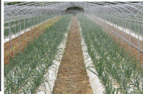
たまねぎの露地栽培

なお規格外のものは、JAの加工所でたまねぎスープ用に加工するなど効率的な経営にも取り組んでいる。