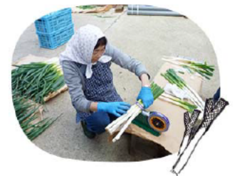
ネギの生産・調整