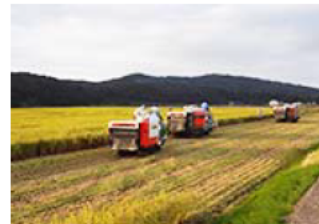
効率化された稲刈り

独自に隣接ほ場の畦畔を除去するなど、大区画化をより積極的に進めてきた結果、経営面積は集落全体の農地の86%（H28）に、大区画ほ場（40a区画以上）は6割ほどに及んでいる。区画の拡大によって大型農機の性能を最大限に発揮できるようになり5ヘクタールの田植えに2日かかっていたのが1日で、稲刈りに1日半かかっていたのが1日で済むようになっている。