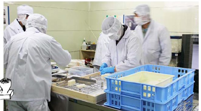
切り餅の製造・加工