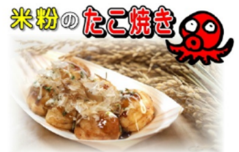
～米粉たこ焼き誕生物語～