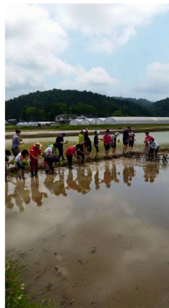
小学生の田植え体験

また、マコモダケ音頭を作製したほか、柏崎野菜応援プロジェクトとして新潟産業大学と連携しキャラクターも作製する等のPR活動を行っている。