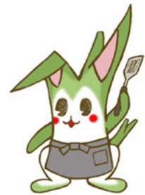
マコモタケのキャラクター「マコモザキくん」