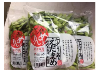
枝豆の生産・販売