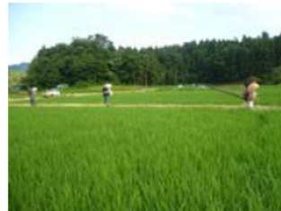
気候に合わせて少なくこまめに行う肥料の散布

安全・安心な農産物を生産するため、米づくりでの肥料は少なくこまめに行ったり、枝豆の収穫作業はできるだけ早く行うなど細やかな配慮の下、生産を行っている。