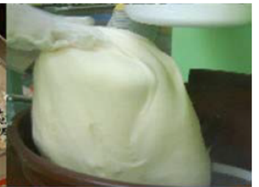
こだわりのもち米・杵・臼でつくられたお餅