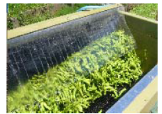
収穫後すぐに冷やされる枝豆