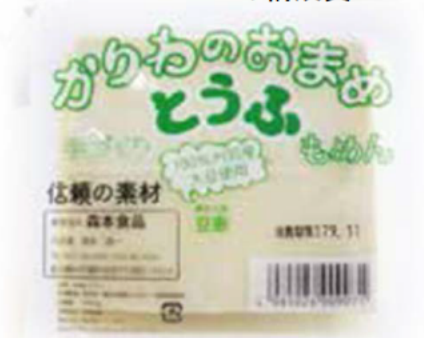
商品化された刈羽産大豆100%の豆腐