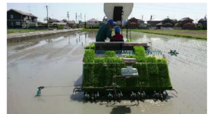
田植え（社員研修中）

農の雇用事業を活用した農業研修を実施し、土地利用型作物、野菜等に関する人材を育成しており、2年間の研修終了後は、自社の社員として雇用している。将来、研修終了者を他の経営体にも人材提供していく方針である。