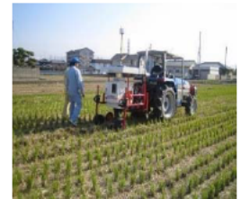
トラクター牽引による土壌成分測定 (ICT活用)

自社製造の堆肥により環境にやさしい農業を実践している。 また、ICTを活用して水稲について土壌成分、食味値をほ場ごとに面的に把握することで、品質の確保に取り組んでいる。