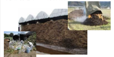
自社製造堆肥による環境にやさしい農業実践

地域と協調しながら農地の借地により規模拡大を進め、耕作放棄地発生防止にも役立っている。 国営かんがい排水事業による安定的な用水を活用し、企業の農業参入の愛媛県最初の優良事例となっている。