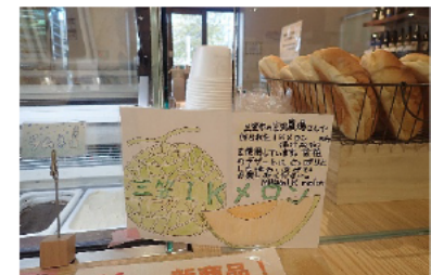
三笠高校生レストラン ESSOR（イール）

公立としては道内唯一の食物調理科を有する北海道三笠高等学校の生徒が運営する「三笠高校生レストラン」にメロン果汁入りアイスクリームを供給することで、付加価値向上に取り組み、地域農産物のPRにも貢献している。