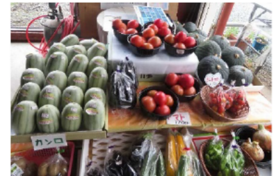
自宅の農産物直売所

購入者からの要望を受け、現在は11作物19種類まで野菜の種類を増加しており、多品目、少量の作付体系を確立している。自宅直売所での販売をはじめ、地域の直売所（2カ所）やJAの直売所に出荷し販路を拡大している。