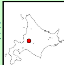
空知中央地区 空知中央用水地区