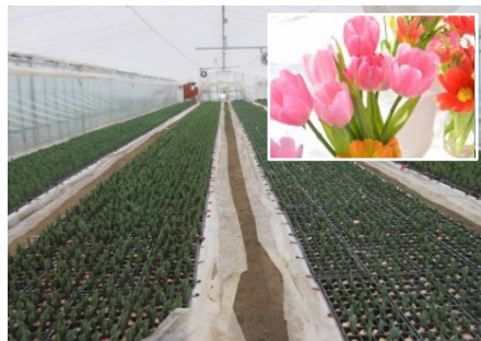
設立当初からのチューリップ栽培

国営及び県営で整備された基盤により、水稲は、早生・中生・晩生の品種、直播・密播・慣行の栽培方法を組み合わせ合わせて作業量の均衡を図るなど、計画的作付けにより大規模な経営を実現している。