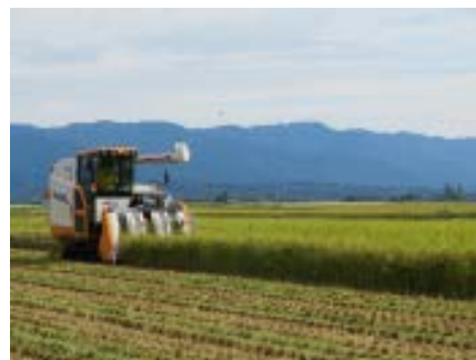
大型コンバインでの米の収穫

農業用水の安定的な確保及びほ場整備を契機とした農地集積により、経営規模拡大を進めてきているが、その過程で近隣の7生産組織と連携し、耕作場所の調整や、機械の貸し借り・共同購入等を進めている。