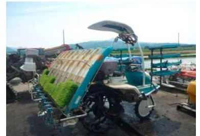
乗用田植機（8条植え）

当初から取り組むメロン、ちんげんさいに加え、近年新たにオータムポエム、みずなを施設園芸に導入しており、収益力向上を図っている。