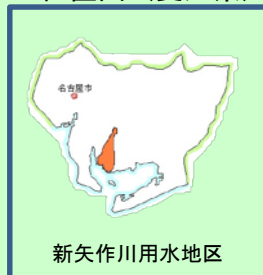
新矢作川用水地区