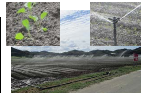
キャベツ栽培ほ場

当社は、独自に就農を検討している学生、一般・社会人を問わず、インターンシップ・農業体験を実施しているが、当農場では、年間4～5人程度の県内外の大学生を受け入れている。正社員の採用に当たってはインターンシップ経験を要するとしており、農業への適性について応募者に十分理解させた上で採用を決定している。