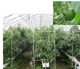
ピーマン栽培ハウス