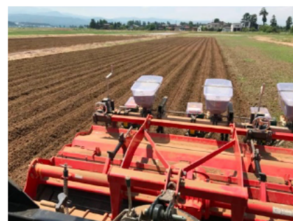
大豆のは種作業状況