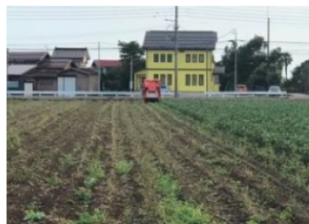
えだまめコンバインによる収穫作業

後継者育成のため、平成30年に30歳代を雇用するとともに、新たに20歳代の雇用を計画している。今後の規模拡大に応じ雇用を増やし、地域の農地、用水を守り後生に引き継いでいく。