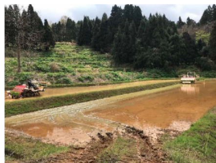
中山間地の営農も担う（田植え）

マーケットインの考え方で、米穀小売業者との契約栽培や最終実需者（炊飯業者等）との直接取引により販売力の強化を図っている。また、最終実需者の要望に対応できるよう、精米プラントを建設し、販路開拓を行っている。