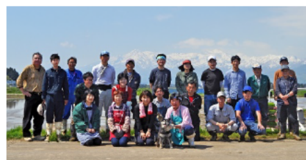
グリーンファーム清里の皆さん

有限会社グリーンファーム清里は、農用地の保全に関する事業等を行う公益財団法人清里農業公社と連携した運営により、有限会社グリーンファーム清里へ一旦農地が集まり、連携する他法人等と土地利用調整を行い集約化している。土地の配分は、作業条件の良い平場地域と不利な中山間地域の農地とをセットとし、連携する法人等とともに地域全体の営農を担っている。農地バンクを民間型で実施する取組を10年以上前から継続している。