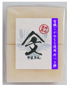
有機栽培のこがねもち（餅米） を使用した白餅

平成28年には6次産業化総合化事業計画の認定を受け、有機栽培の餅米を使った白餅や、自家栽培しただいこんの酢漬け等の加工品の販売を行っている。