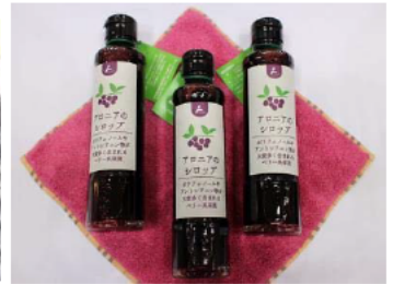
アロニアのシロップ