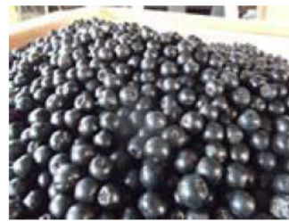
収穫されたアロニア

平成26年度に新潟県の補助事業を活用しライスセンターを新設して、地域の乾燥調製も積極的に受け入れできるように体制を整えた。