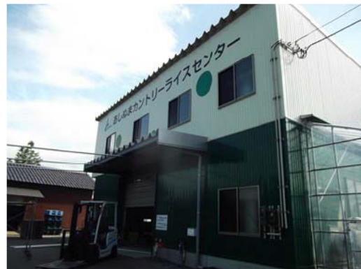
地域の乾燥調製も引き受けているライスセンター