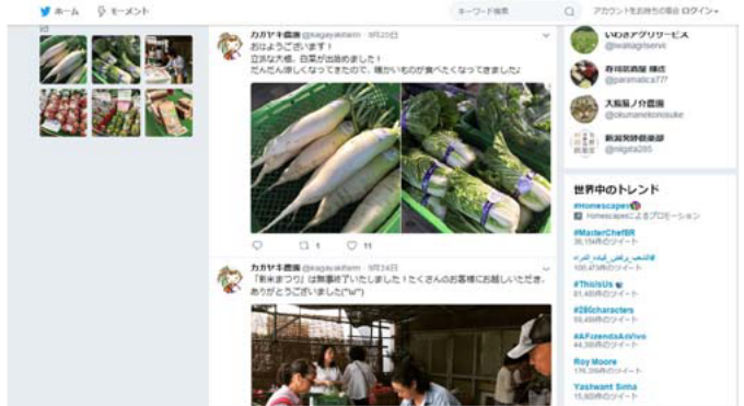
ツイッターによる情報発信

また、農作業記録をクラウド型グループウェアに保存することで、作業時間の集計が容易になり、病虫害発生などのトラブルも情報共有して解決できるようになった。