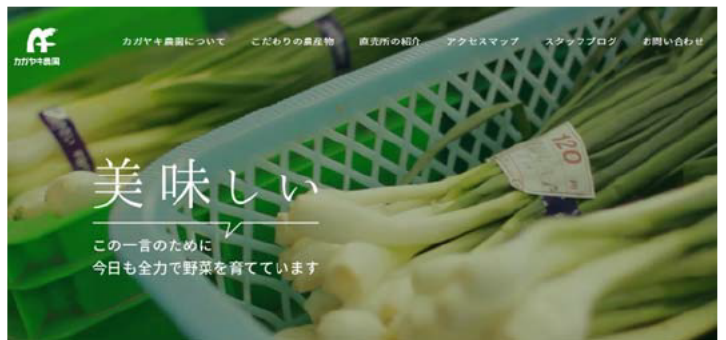
動画も取り入れ洗練されたHP

また、インターネット販売により顧客を県外に開拓することができ（H23からH28でネット販売額が5倍以上に増加）、しかもそのことが情報発信につながり、直売所への来店を促進させた。