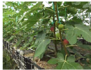
コンテナ栽培のいちじく

水田においてスイートコーンを作っている先進的な農家のノウハウ、また、本地域の試験ほ場での低コスト水稻栽培技術を導入した（H4～8年度に信濃川水系事務所等が実施した大区画実証展示事業）。