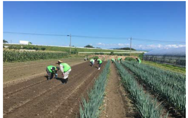
障害者福祉サービス事業所との農福連携

米袋への押印作業や野菜の栽培管理を障害者福祉サービス事業所に委託して3年になる。更に、食品加工に関しても経営体構成員の手が回らないので、障害者福祉サービス事業所に作業委託する等、農福連携に積極的に取り組んでいく。