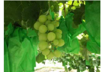
ハウス栽培のぶどう