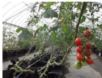
養液栽培の トマト