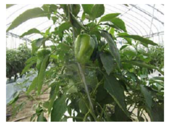
養液栽培の ピーマン