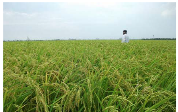
構成員による水稲の生育 状況確認