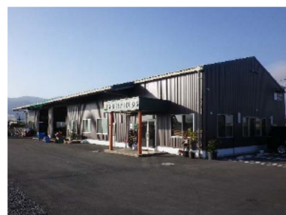
有限会社 サンフィールズ

少ない人数で栽培可能な品目を選びながら、安定した単価で販売できる販売先を探し、平成20年に本法人を設立しました。現在では、販売先は県内のみならず、関西や中京地方に広がっています。また、ネット販売や企業・大学とのコンソーシアム等により、自社農場で生産された、安心・安全な農産物販売を行うなど積極的な取り組みを行っています。