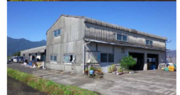
有限会社 中辻花卉園 栽培施設