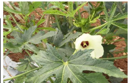
綺麗に咲いたokraの花

okraやたまねぎ等の栽培では、さとうきびの精製過程で出る糖蜜を与えることで、野菜の甘みを向上させたり、トマト栽培においては、糖度を上げるため、海水を散布したりして品質の向上に努めている。その結果、平成28年のokraの販売額で上位となり、JAokra部会から表彰を受けた。