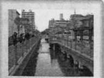
◆アクアロードかしはら 長瀬川に沿った遊歩道には、所々に史跡カルタが埋め込まれ、川に少し突出した休憩所があります。