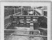
◆二俣分水 大和川からの水がここで長瀬川と玉串川へ2:3に分けられる分岐地点休憩ポイント