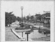
◆安中5丁目公園 長瀬川に沿って水辺やベンチ、あすまやなどが整備された公園で、金岡公園と同じように雨水を貯蓄する機能も備えています。