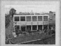
◆築留土地改良区事務所 長瀬川・玉串川の清掃活動、施設の維持・改修工事を行います。また、鯉の放流、水生植物帯設置などを行い快速水辺空間づくりを行っています。