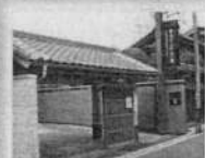
◆寺内町ふれあい館(八尾まちなみセンター) 寺内町は天文10年(1541)頃に顕証寺(通称上人が建立した西証寺を改号)を中心に建設され450年以上の歴史を持ちます。江戸時代の町割りがほぼ当時のまま残っており、道標・町家なども現存し、歴史的な雰囲気の間近とされています。