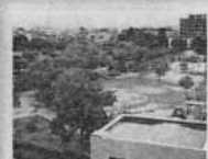
◆金岡公園 金岡公園は長瀬川の景観を取り入れた、水と緑あふれる親水空間として、テニスコートや遊具、あずまやなどが整備された公園です。またここには長瀬川の犯濫を防ぐため、雨水を一時的に広場に貯蓄できる機能も備わっています。