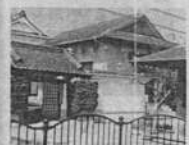
◆延命寺 藤原時代作の本尊・阿弥陀如来立像、高さ4mの木造地藏菩薩坐像は大阪府の指定文化財。