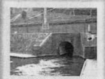
◆大和川治水記念公園と長瀬川・玉串川の取水口 治水公園に登る手前には、築留土地改良区の建物の前には、大和川から長瀬川・玉串川へ取水する2つの水路の1つ2番水路があります。大和川の堤防を抜けるレンガ積み水のトンネルは国の登録有形文化財となっています。