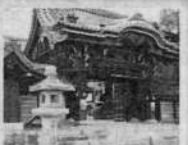
◆顕証寺(久宝寺部坊) 久宝寺御寺内町の中心である、共同利用されて現在の公民館の役割も持っていました。現在の本堂は宝永7年(1710)に建てられたもので、重文級の価値があるといわれています。